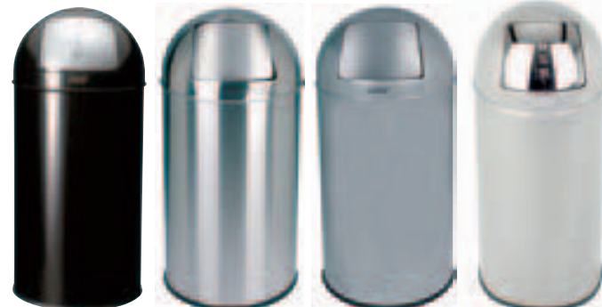
PB-3140-BLA PB-3140-MSSTL PB-3140-SIL PB-3140-SSSTL